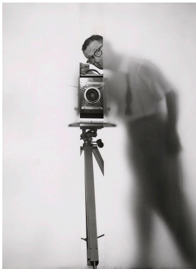
Zelfportret met een fotoestel Deardoff 1950-1955

Rue des Minimes 21 Miniemenstraat 1000 Brussels