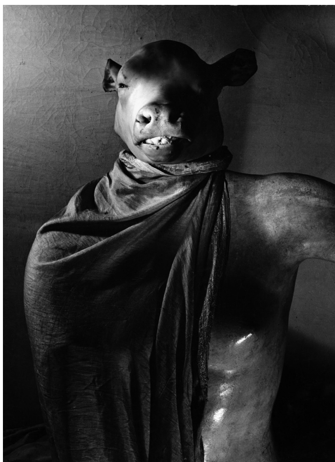
De Minotaurus of De Dictator , Parijs, 1937, Coll. familie Blumenfeld

De Dictator. Amsterdam, 1933 – Parijs, 1937