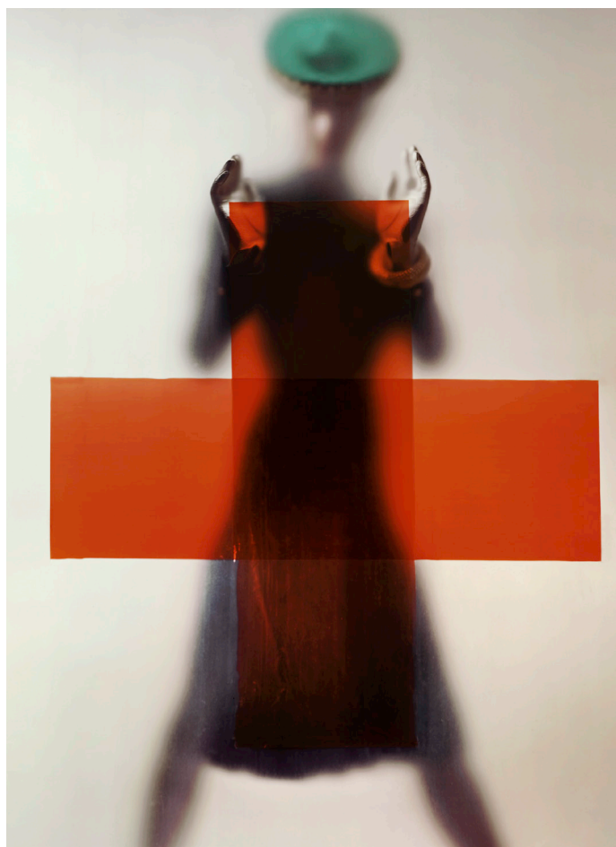
Do you part for the Red Cross, New York, 1945, Variant van de cover van Vogue

Vrijheid van vorm en kleur. New York, 1941-1950