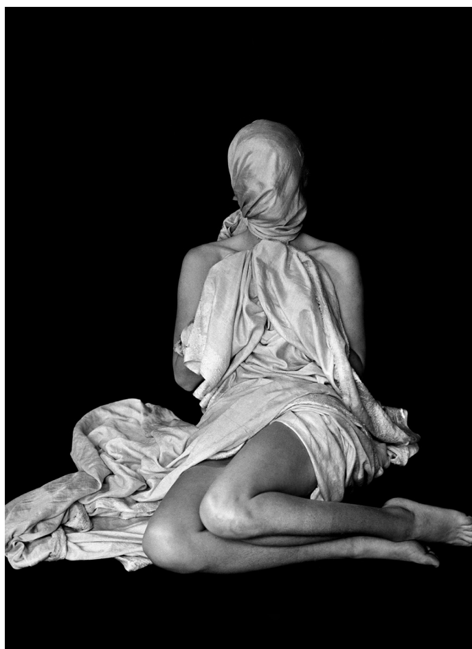
De terughoudendheid , Parijs, 1938, Coll. familie Blumenfeld

Experimenten en modedefotografie, Parijs, 1938-1939