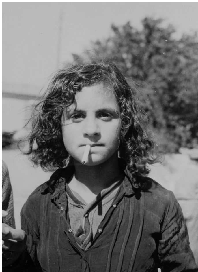
Zonder titel , Saintes-Maries-de-la-Mer, circa 1928, Coll. familie Blumenfeld

Zigeuners. Saintes-Maries-de-la-Mer, 1928-1932