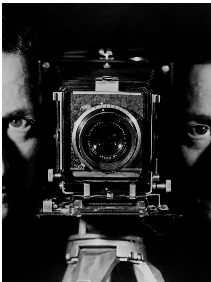
Dubbel zelfportret in het Linhof, Parijs, 1938, Overdruk

Bruisende avant-gardes. Parijs, 1936-1938